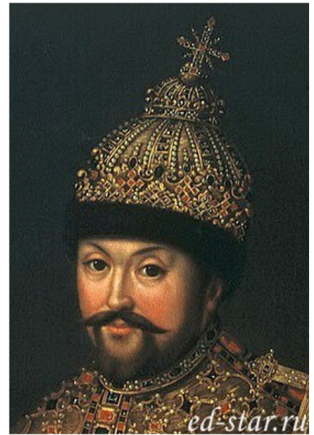
Рисунок 1. Михаил Фёдорович Романов

В начале XVII века Россия пережила Смуту и с приходом к власти династии Романовых начала постепенно восстанавливаться. Первым царем из новой династии стал шестнадцатилетний Михаил Федорович Романов, которому предстояло завершить войну с польско-литовскими и шведскими интервентами, провести реформы во внутренней политике с целью выхода из кризиса. Первым Романовым предстояло не только восстановить страну, но и заложить основы для ее будущего величия.